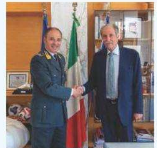
Il generale di brigata Sciaraffa e Bardi

stati affrontati i temi caldi del territorio, con particolare attenzione alla legalità economica, alla tutela delle imprese sane della Basilicata e al monitoraggio strategico delle risorse pubbliche. «La Regione Basilicata - conclude Bardi - continuerà a essere una casa di vetro e un partner solido e leale per le Fiamme gialle. La sinergia tra le istituzioni regionali e il comando lucano della Finanza è massima, con l'obiettivo comune di garantire sicurezza, trasparenza e legalità ai cittadini e al tessuto produttivo della nostra terra».