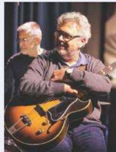
Guido Di Leone

Chitarrista raffinato, interprete di straordinaria sensibilità e autentico riferimento artistico e umano per generazioni di musicisti, Guido Di Leone ha rappresentato per studenti e colleghi un esempio di rigore, passione e dedizione alla musica. La sua improvvisa scomparsa ha profondamente colpito il mondo del jazz