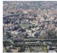
POTENZA Una panoramica

istituzioni, formazione, credito cooperativo e territorio scelgono di condividere visione e responsabilità. Questa alleanza dà forza a un'idea semplice ma rivoluzionaria: le opportunità non si attendono, si generano insieme».