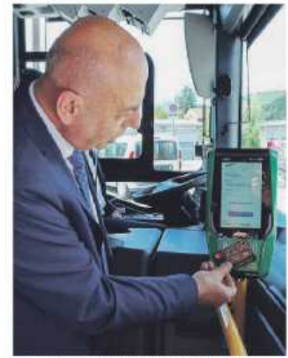
TREN E BUS Attuato il servizio Fal Tap&amp;Go

L'importante infrastruttura dovrebbe essere recuperata in concomitanza con la riapertura delle scuole, a settembre