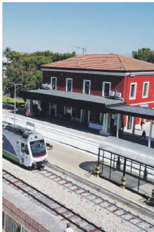
ALTAMURA Messa a nuovo la stazione delle Fal