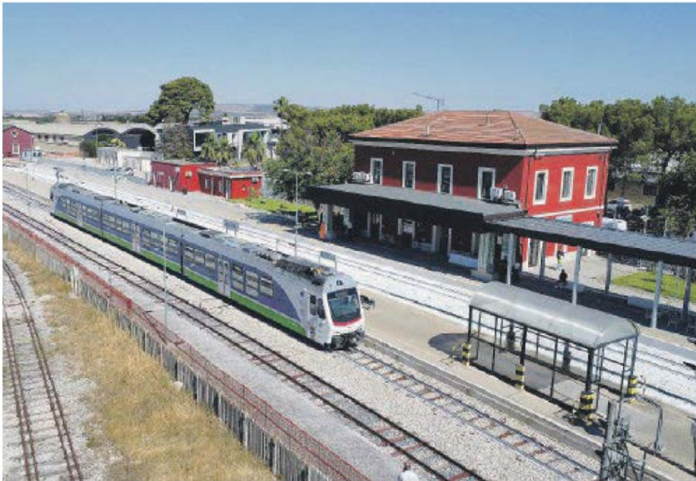
Inaugurata ieri la nuova stazione Fal di Altamura