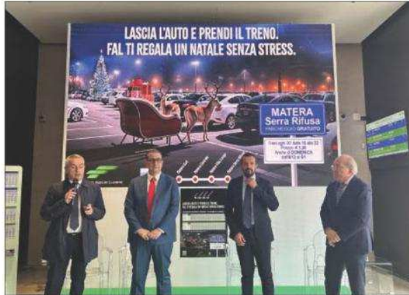
I servizi straordinari di Fal per le prossime cinque domeniche a Matera