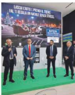
La conferenza a Matera