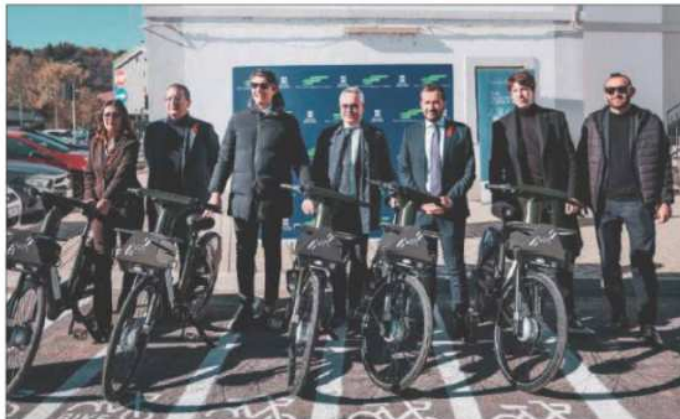
Un momento della cerimonia di presentazione del nuovo servizio

Anche in Basilicata - ha detto il Presidente Fal, Vittorio Zizza - nell'ambito dei progetti di sharing mobility, avviamo da oggi il servizio di Bike sharing, che rappresenta un tassello importante nell'ampia visione di intermodalità dell'Azienda che rappresento. Sono convinto che questo servizio favorirà ancora