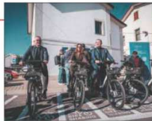
L'inaugurazione delle bici elettriche