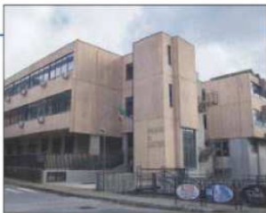
Il Tribunale di Lagonegro