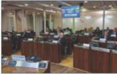
Il Consiglio regionale

*In abbinata all'edizione l'AltraVoce dell'Italia de il Quotidiano del Sud € 0,75