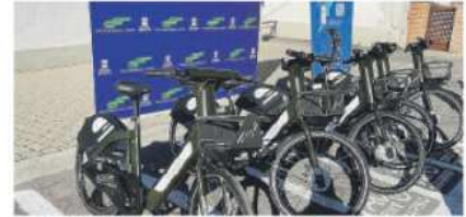
POTENZA Le bici elettriche in una stazione Fal

Il progetto delle Ferrovie appulo lucane per l'intermodalità