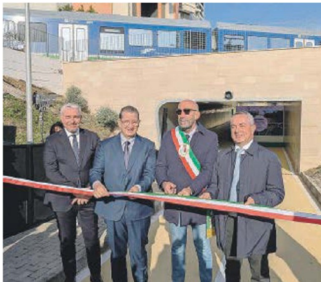
Ieri l'inaugurazione del nuovo sottopasso ciclopedonale di Bari