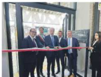
POTENZA Il terminal Gallitello e un momento della cerimonia inaugurale

gibile di connessione ed interconnessione trasportistica, ma soprattutto, preserviamo la nostra storia e restituiamo alla città un luogo identitario che testimonia appartenenza al territorio e alle persone. Credo - ha aggiunto - che abbiamo vinto una scommessa importante e coraggiosa: trasformare una vecchia officina in un moderno contenitore che servirà alla città come strumento, speriamo indispensabile, per favorire la mobilità cittadina, ma soprattutto per riconoscere e celebrare l'azione umana compiuta ogni giorno da tante persone di questa Azienda. Oggi raccogliamo un ulteriore importante ri-