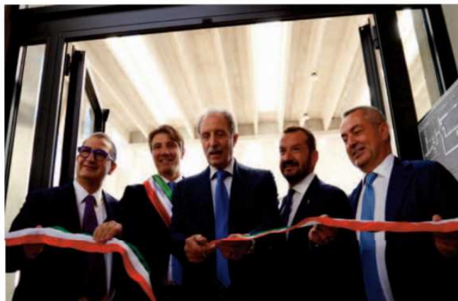
Alcuni momenti dell'inaugurazione