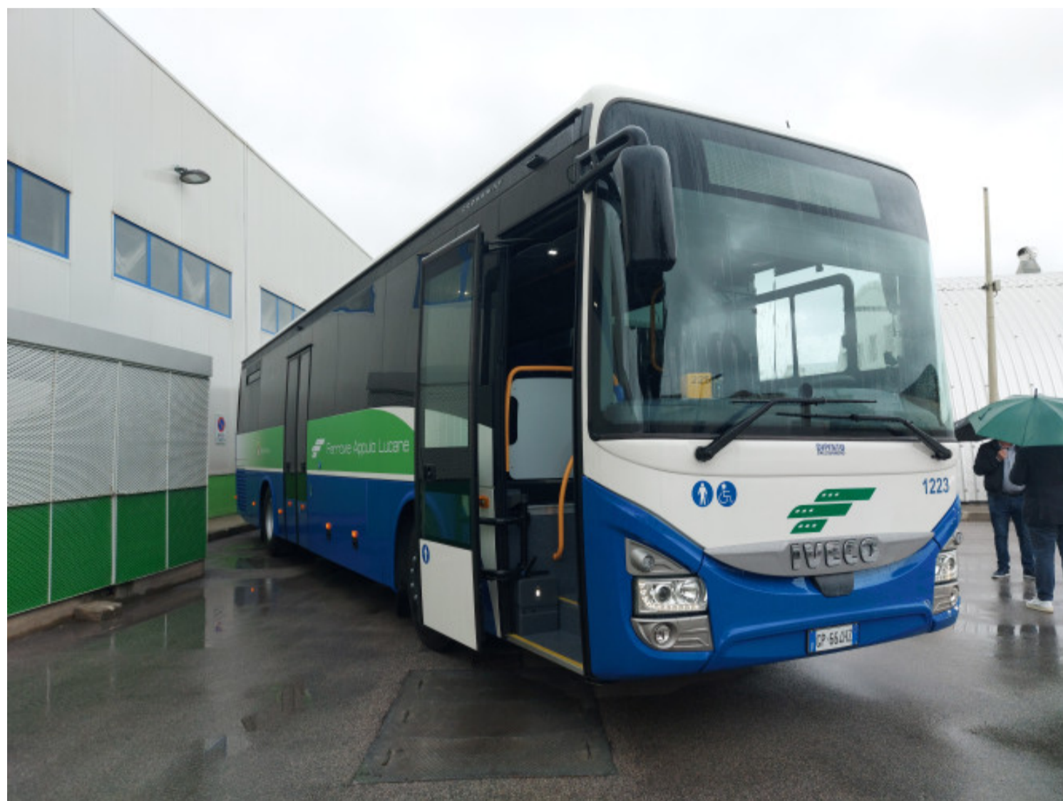
Mobilità ancora più sostenibile con i nuovi bus euro 6 di Ferrovie Apulo Lucane

Publicato il 18 Ottobre 2023 | By Carlo Prunas | In Mobilità sostenibile , RICERCA E TECNOLOGIA