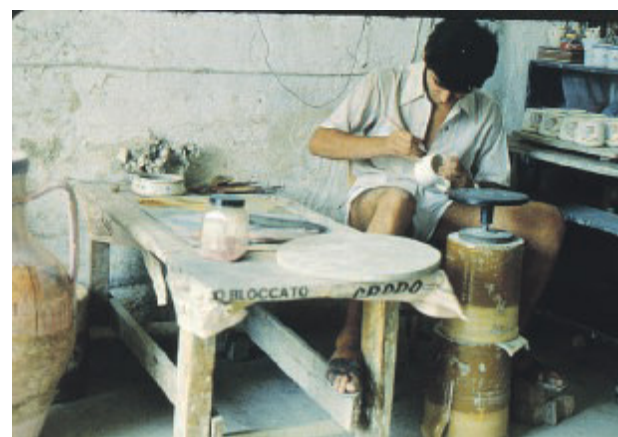
RICUCIRE Un artigiano del recupero di ceramiche

I l trapano a corde, il filo di ferro, il cemento e la tenaglia erano gli utensili che i cuoi piatti utilizzavano per riparare i grandi piatti di argilla dove veniva servita la minestra per l'intera famiglia contadina.