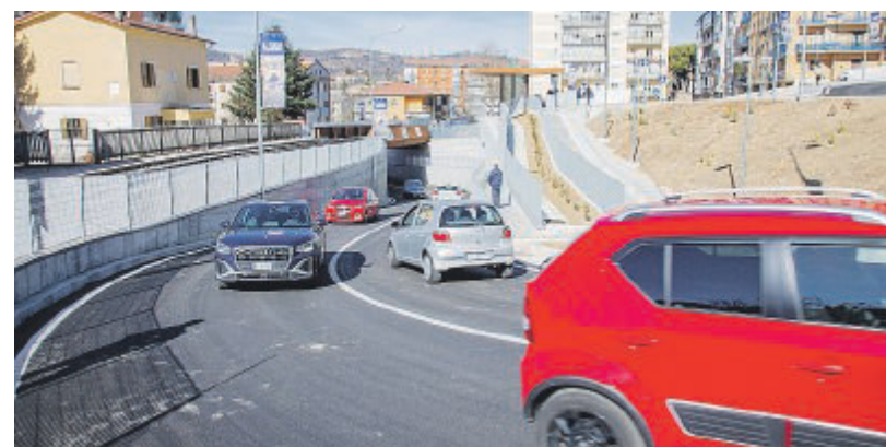
VIA LIBERA Le auto nel sottopasso