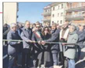
Il taglio del nastro dell'opera delle Fal a Potenza