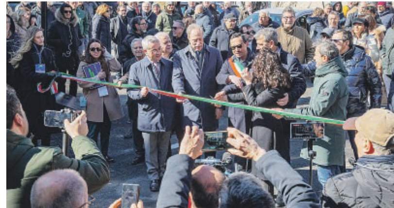
CERIMONIA Il taglio del nastro