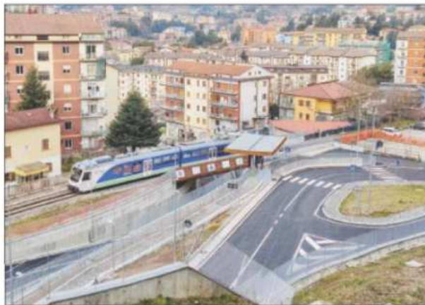
Alcune immagini dell'inaugurazione del sottopasso, alla presenza dei dirigenti Fal e delle istituzioni

«Anche nella città capoluogo della Basilicata - ha continuato - abbiamo voluto