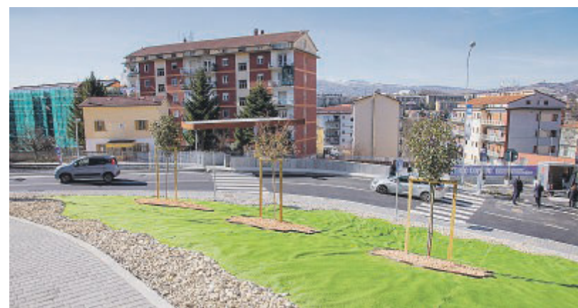
RIQUALIFICAZIONE Arredi urbani