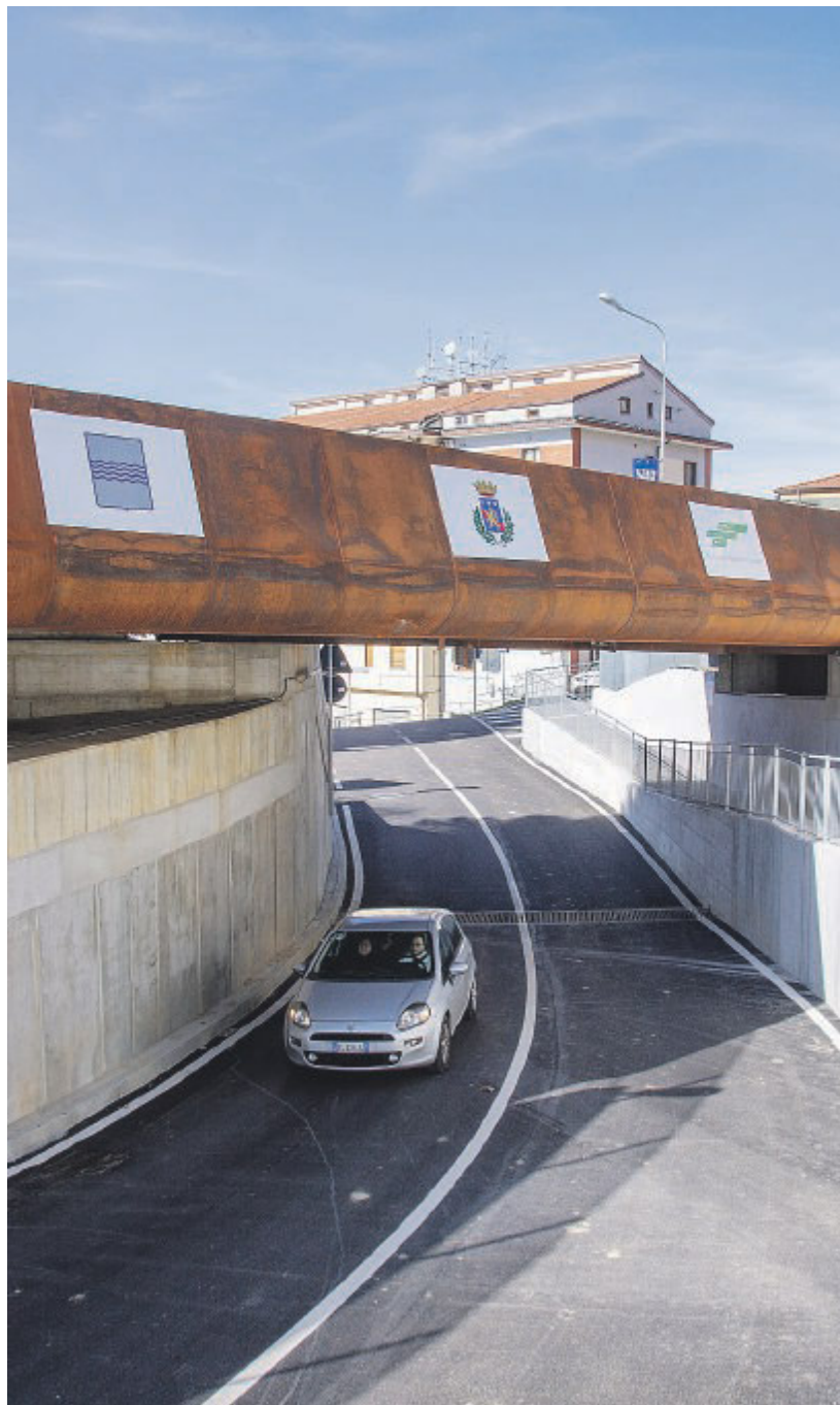
VIA ROMA Il sottopasso