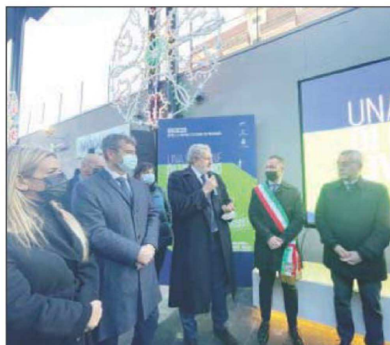
Nuova stazione Fal Modugno; a fianco un momento dell'inaugurazione