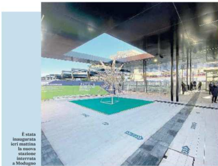
È stata inaugurata ieri mattina la nuova stazione interrata a Modugno