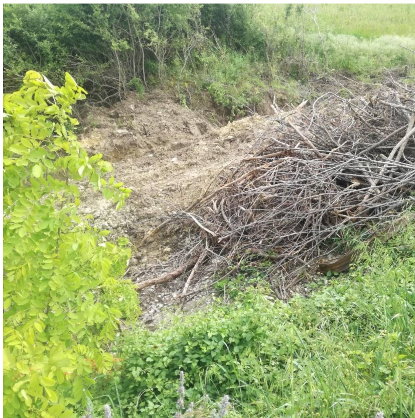
Materiale trasportato da torrente e piogge