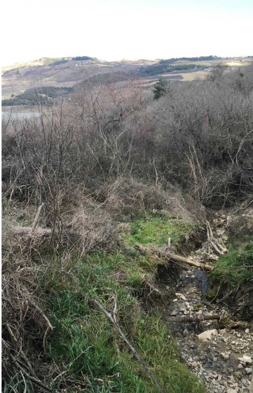
Materiale trasportato da torrente e piogge