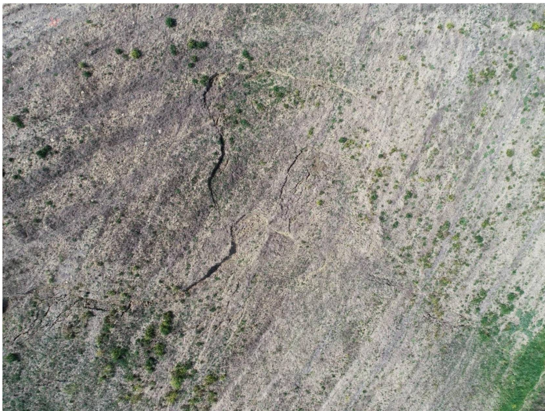
Movimento franoso su terreno privato