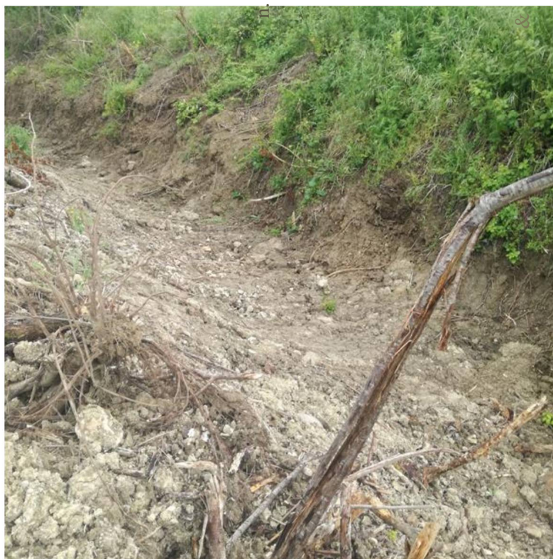
Materiale trasportato da torrente e piogge