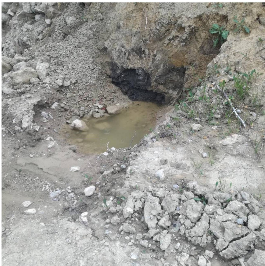
Acqua superficiale che fuoriesce dalle spaccature dell'argilla