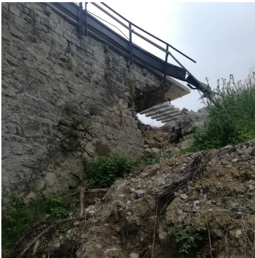
Spalla del ponte