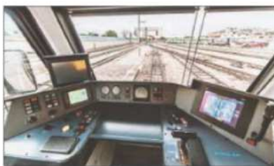
L'interno di un mezzo delle Ferrovie Appulo Lucane