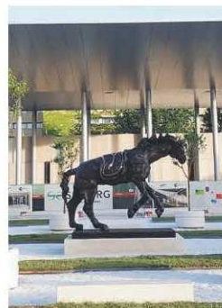
SCULTURA L'opera di Salvador Dalì