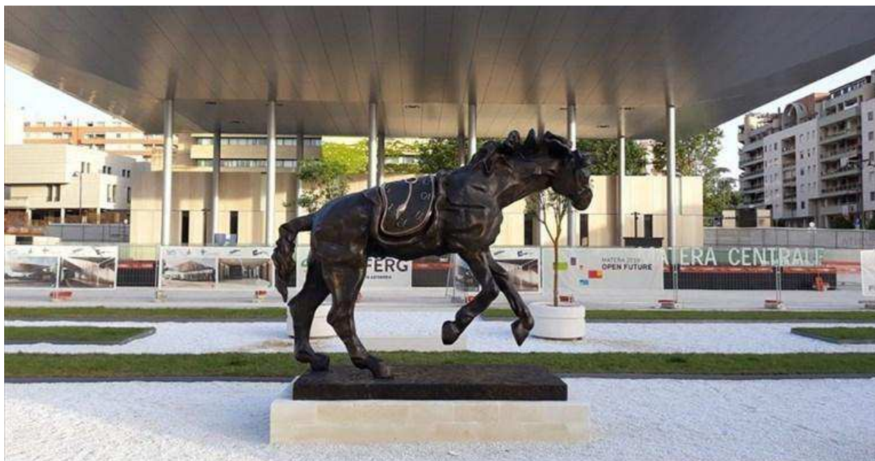
Fal per l'arte: statua di Dalì alla stazione di Matera centrale.