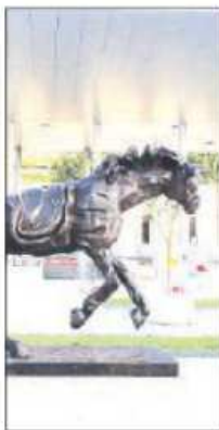
Il cavallo di Dalì alla stazione

Quando abbiamo riqualificato questa porzione di Piazza antistante la stazione, lo abbiamo immaginato come uno spazio che potesse ospitare