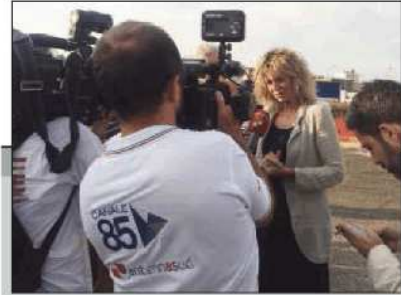
Sul cantiere della Statale 96 Bis

IL MINISTRO ha voluto visitare anche il popoloso borgo La Martella, dove ha ammirato la chiesa