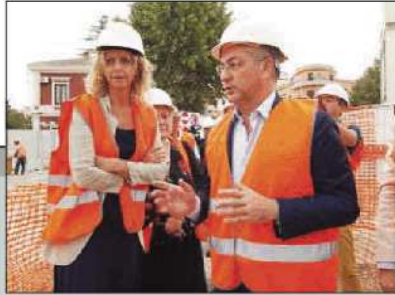
Sopralluogo in piazza

Il ministro per il Sud torna a Matera e conferma il «fiato sul collo» del Comune