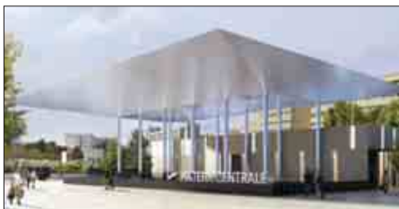
Nelle foto il cantiere e come sarà la nuova stazione di Matera centrale realizzata dalle Fal