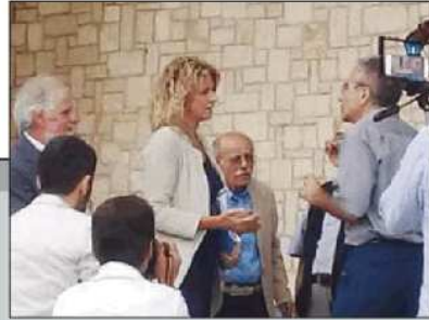
Passaggio a borgo La Martella

RESTA piazza della Visitazione il maggior cruccio del ministro Lezzi, che ieri ha visitato il cantiere Fal