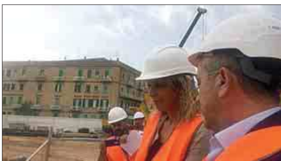
Nelle foto il ministro per il Sud, Barbara Lezzi, sul cantiere per la realizzazione della nuova stazione di Matera centrale delle Fal

tempi previsti e garantiti alla cittadinanza di Matera ed al Governo, si è intanto concluso il primo step dei lavori e ieri Fal ha potuto riaprire Via Aldo Moro e la bretella di Via Matteotti, ripristinando la normale circolazione au-