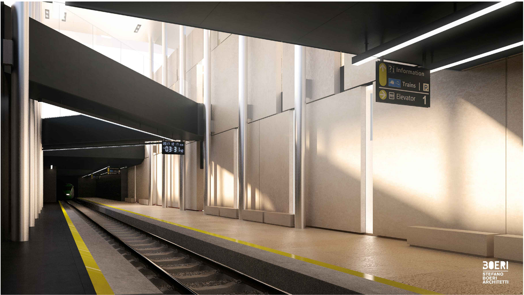
Vista dalla banchina