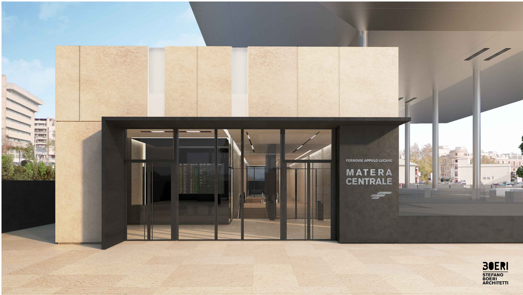
Vista esterna – ingresso