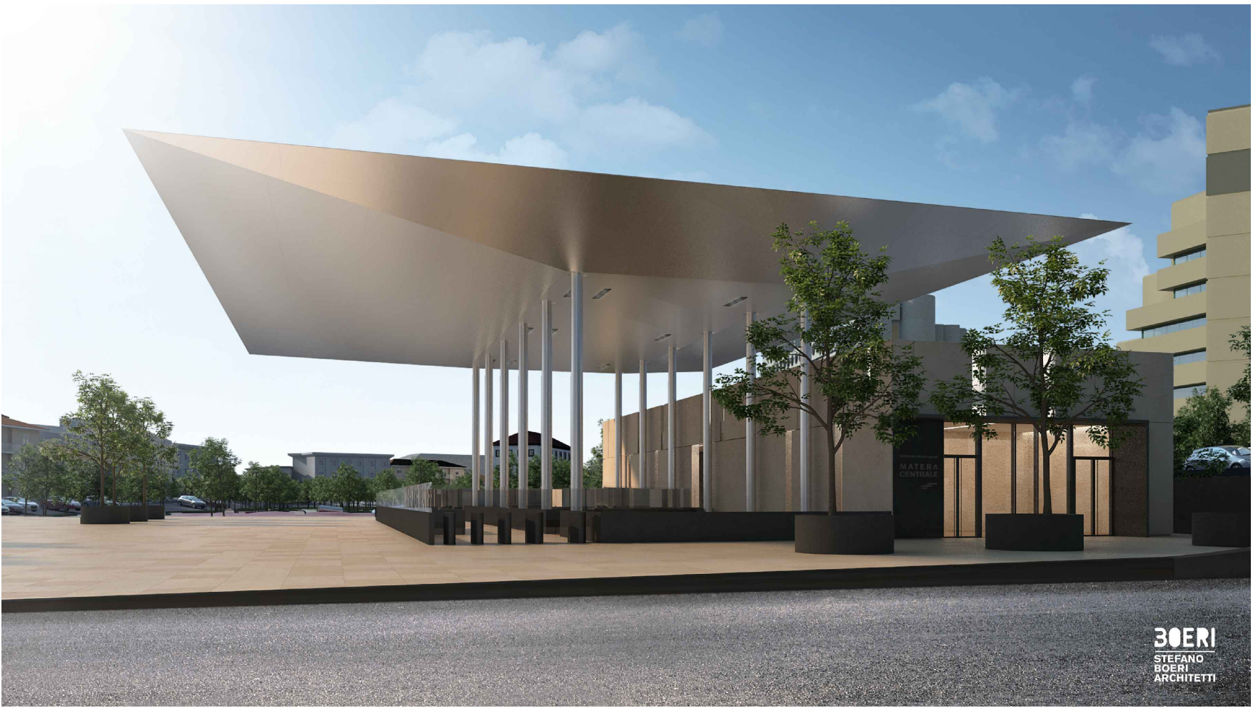
Vista esterna – laterale