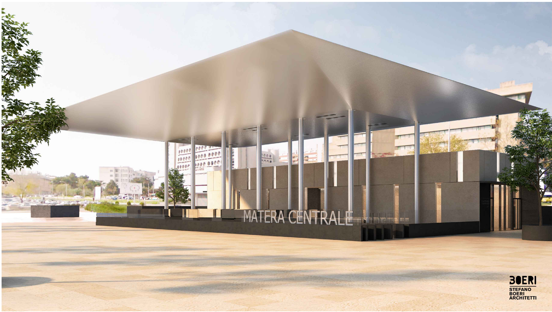
Vista esterna – piazza