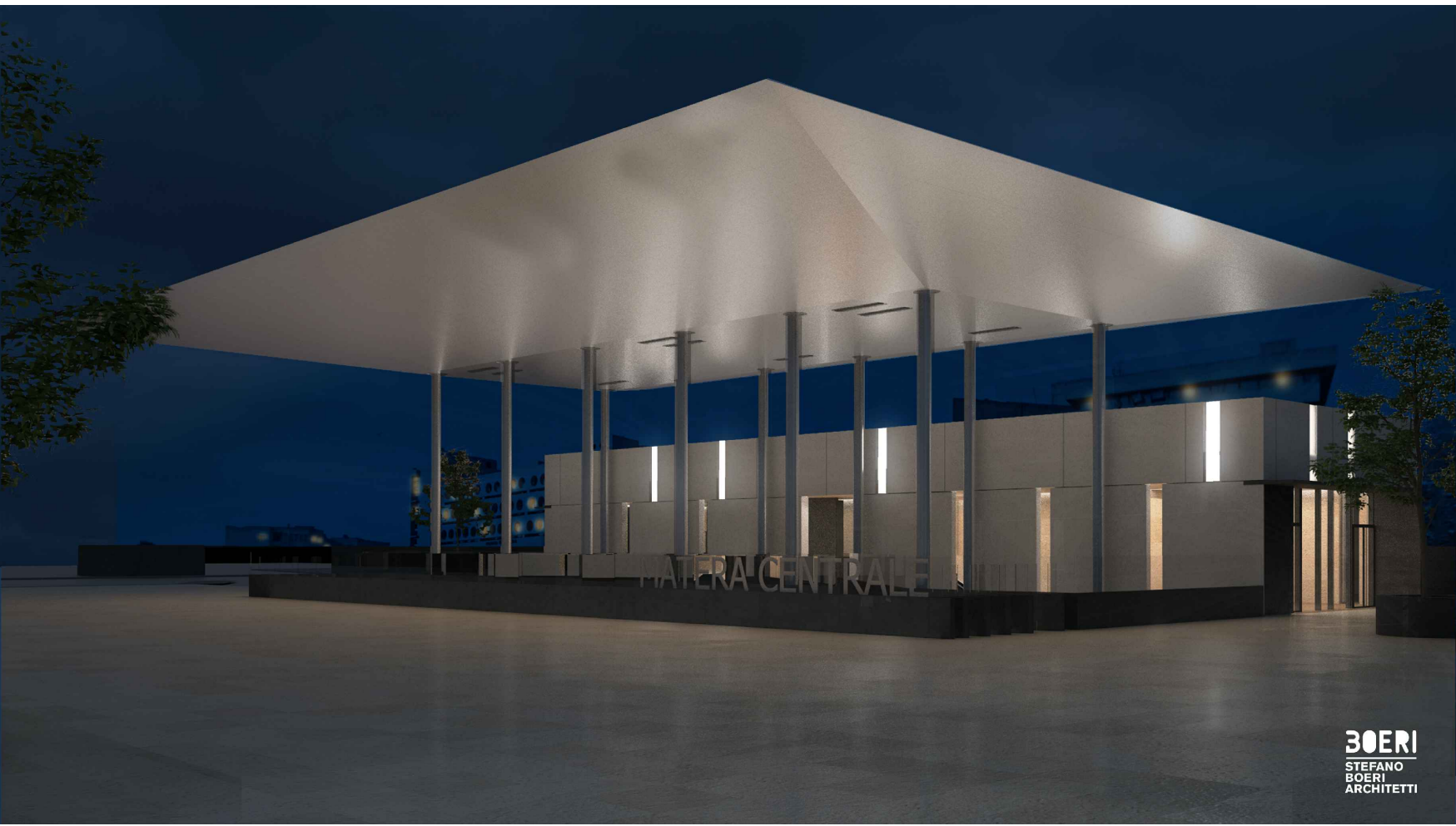
Vista esterna notturna