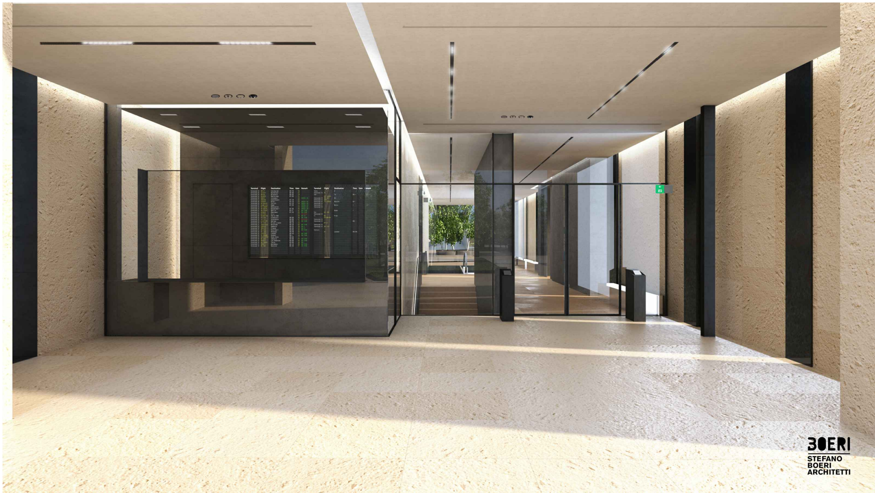
Vista interna – biglietteria