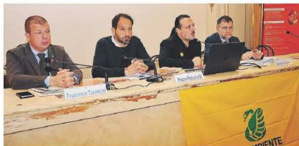
BARI I relatori al convegno su «Ecosistema urbano»

Dall'ultimo anno, rilevano gli analisti della ricerca, si registra una sorta di livellamento al centro classifica, di città cioè i cui indici ambientali oscillano di pochi decimali, non