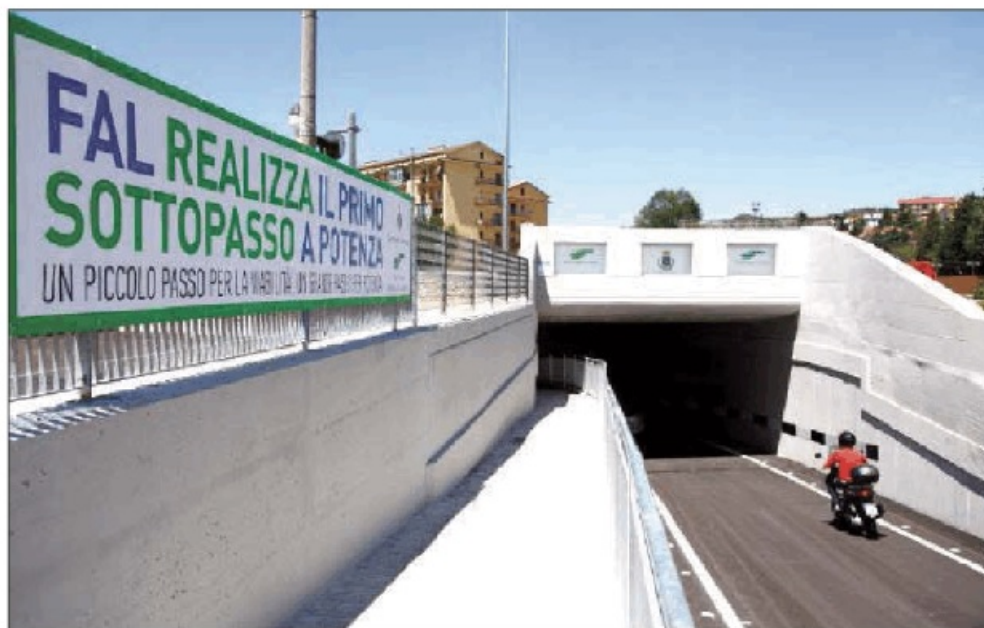
L'ingresso del sottopasso di via Angilla Vecchia. In basso l'altra uscita, il passaggio del treno e Colamussi

Lo sguardo al futuro attiene invece la realizzazione del sottopasso di Via Calabria, per il quale la Fal è in attesa dell'autorizzazione del Comune e i cui lavori dovrebbero iniziare a settembre, e poi a seguire sarà realizzato il sottopasso di via Roma nel rione Mancusi. E' questo il lotto completo dei lavori che sono stati finanziati con fondi Po Fesr 2007/2013 (poco meno di nove milioni) e che sono passati dalla Regione Basilicata al Comune di Potenza, che a sua volta ha individuato la Fal come soggetto attuatore.