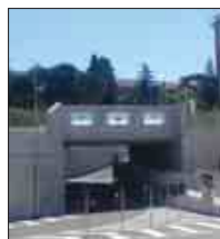
Inaugurato ieri il sottopasso Fal di via Angilla Vecchia. A PAG. 12