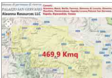
Un pozzo e il permesso "Palazzo San Gervasio" ALLE PAGINE 4 E 5