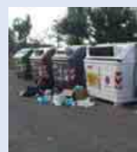
A PAGINA 14

Acta e Comune annunciano il pugno duro contro i trasgressori: multe salate per chi non rispetta le regole di conferimento