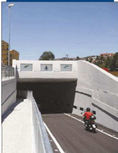
Il nuovo sottopasso di via Angilla Vecchia

Negozianti felici per il sottopasso aperto sotto le Fal