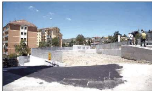
A sinistra il sottopasso visto dall'altra parte e, accanto, la zona su cui i commercianti chiedono interventi in tempi brevi (Mattiacci)