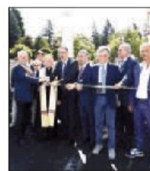
Il taglio del nastro

L'INTERVENTO di potenziamento del trasporto metropolitano di Potenza è stato finanziato con 8,9 milioni di euro di fondi europei Po Fesr 07/13. Le opere riguardano tre sottopassi (Angilla Vecchia, via Calabria e via Roma) che consentono l'eliminazione di altrettanti passaggi a livello.