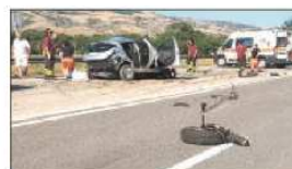
Il tragico incidente a Salandra sulla Basentana

CERSOSIMO Autobus gratis agli studenti senza la scuola