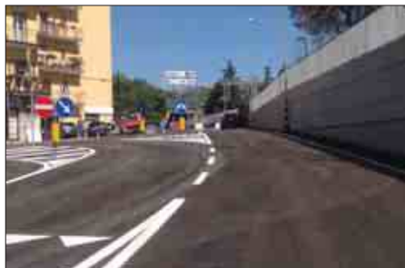
A destra il taglio del nastro dopo la benedizione del vescovo Ligorio, a sinistra la nuova viabilità all'uscita del sottopasso

vecchia, a cui hanno preso parte rappresentanti dell'amministrazione comunale di Potenza, della Regione Basilicata e delle Fal, si proseguirà con la realizzazione di interventi per il superamento dei passaggi a livello in Via Calabria e Via Roma. A breve termineranno anche i lavori per il nuovo terminal Fal in via del Gallitello. Prima del taglio del nastro ieri a benedire il sottopasso in Via Angilla Vecchia mons. Salvatore Ligorio vescovo di Potenza.