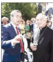
Colamussi e Ligorio

I LAVORI sono iniziati l'1 ottobre del 2015 e sono stati completati il 5 luglio. La durata complessiva è stata di 9 mesi. Un mese per realizzare la struttura e tre mesi sono stati necessari per la viabilità e le opere di completamento. Per 5 mesi sono stati interrotti per interferenze con Telecom e Acquedotto Lucano.