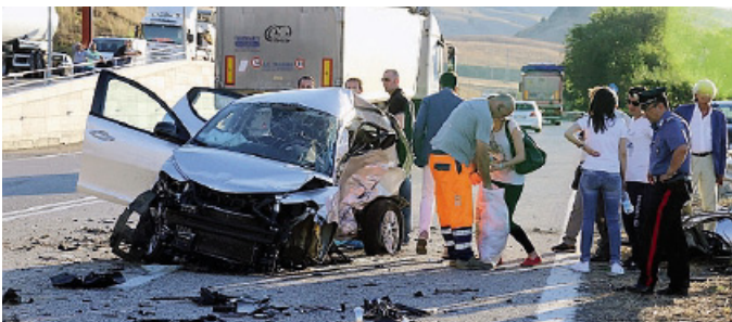
STRADA L'incidente di ieri sulla Basentana

Incidente sulla Basentana ennesima vittima lucana