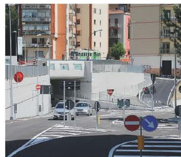
TUNNEL Il sottopasso appena aperto