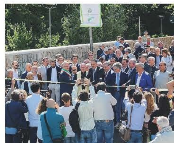
OPERA Il taglio del nastro