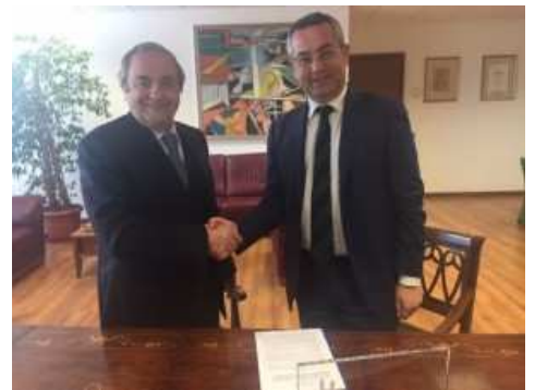
La firma del protocollo d'intesa

lucane, che aggiunge: "Partiamo con il terminal di Serra Rifusa, per cui già la settimana