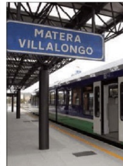
La stazione di Villa Longo

Matera Sud a Matera Ospedale Santa Maria delle Grazie che prevede la realizzazione di 850 metri di linea e di una nuova stazione di testa presso l'Ospedale Santa Maria delle Grazie».