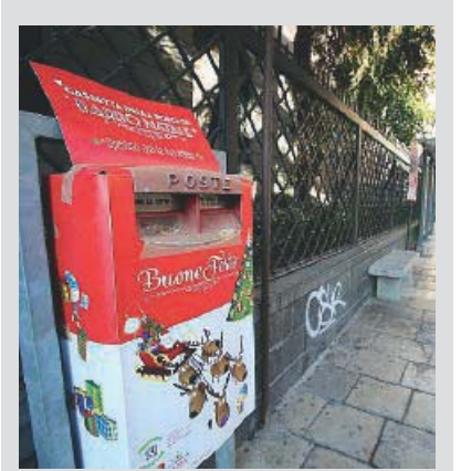
BABBO NATALE Letterine