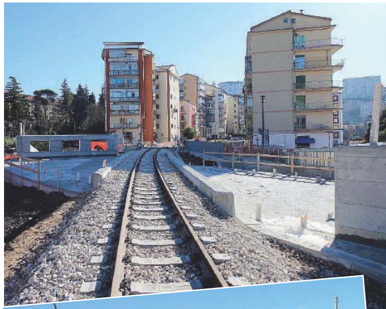
FAL I lavori al sottopasso ferroviario di via Angilla Vecchia