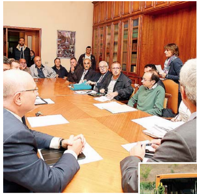
TRASPORTI URBANI L'incontro ieri pomeriggio in Prefettura a Potenza. Sotto: i lavoratori con i bus fermi e le scale mobili chiuse

dissesto: il Comune ha speso più di quanto poteva e si è trovato nella situazione di non poter più far fronte ai debiti». Appello a trovare soluzioni - per i lavoratori e per la città - condiviso dal prefetto D'Acunto, che però invita a non scordare la situazione del dissesto in atto. Intanto, dev'essere predisposto «un piano di ripianamento dei debiti che vanta Cotrab».