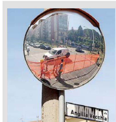
SOTTOPASSO Al via i lavori

Il secondo passaggio a livello a partire sarà quello di via Napoli, mentre l'ultimo sarà quello di rione Mancusi, dove i cittadini hanno contestato il progetto preliminare delle Fal chiedendo una variante e il sindaco di Potenza Dario De Luca è impegnato in un'opera di mediazione tra le istanze degli abitanti del rione e l'esigenza di eliminare quello scomodissimo passaggio a livello.