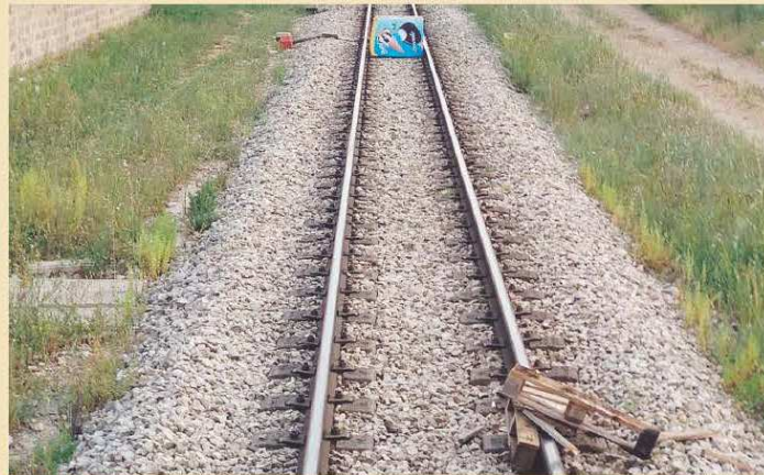
OSTACOLO In primo piano i pallet e sullo sfondo il frigorifero sui binari della linea ferroviaria Bari-Matera

● Rischio di un nuovo disastro, ieri pomeriggio, sulla linea ferroviaria tra Bari e Matera gestita dalle Ferrovie Appulo lucane (Fal). Nel tratto dei comuni di Binetto, ignoti hanno sistemato sulla sede dei binari un frigorifero da bar e alcuni pallet di legno. «Un atto vandalico» riconosce in una nota l'azienda - che avrebbe potuto causare gravi danni ai passeggeri del treno, se non fosse intervenuto il sistema di controllo marcia treno Ssc Train Stop che Fal, unica ferrovia isolata in Italia ad averlo attivato, ha messo in funzione da dicembre 2017. Sarebbe stato lo stesso capotreno, dopo aver fermato il traffico in transito, a rimuovere gli ostacoli dal binario, consentendo la regolare ripresa della circolazione dopo poco tempo. L'Azienda ha richiesto l'intervento dei carabinieri sporgendo denuncia contro ignoti.