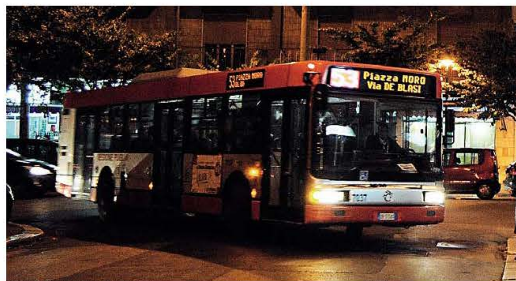
CAPODANNO IN PIAZZA Piano straordinario dei trasporti per la notte del 31

Ferrotamviaria invece garantirà 12 mila posti a sedere con le dodici corse di andata, a partire dalle 19 e 35 e sino alle 3 e 10, sulla tratta Ospedale San Paolo-piazza Moro e per le otto fermate del itinerario. Per il ritorno, invece, sei le corse in programma con la prima prevista cinque minuti dopo la mezzanotte (roba insomma da non aspettare nemmeno l'arrivo